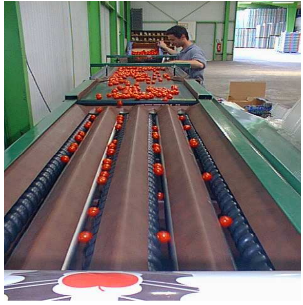
(fotografía de una clasificadora 4 líneas)

Brumización : La brumización es imprescindible, permite el desliz de la fruta sobre el material. La brumización es ajustable en tiempo (programación del tiempo de brumización y del tiempo de paro entre dos brumizaciones. Surtidores orientables. (alimentación de agua corriente) con grifo de paro y filtro.