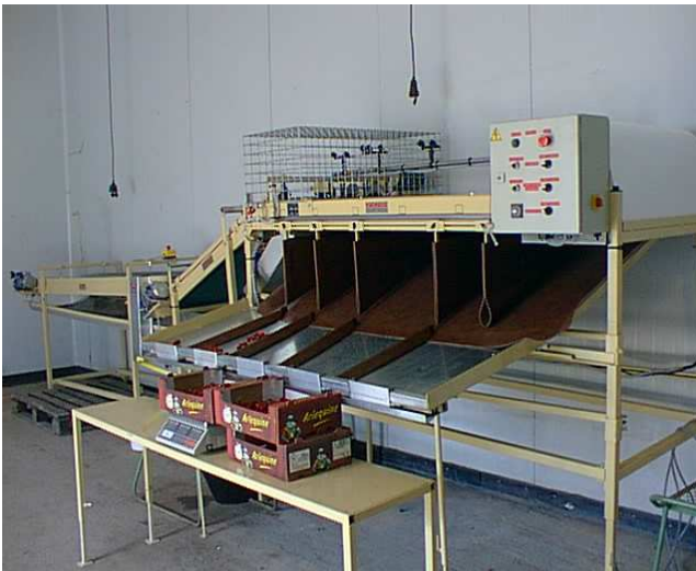
(fotografía a la derecha).

La salida de la fruta se puede hacer al gusto del cliente, sobre un plano inclinado (solución económica, fotografía a la izquierda), o sobre cintra extractora, solución más suave para la fruta consecuencia de la poca distancia entre los tornillos de clasificación y la cinta,