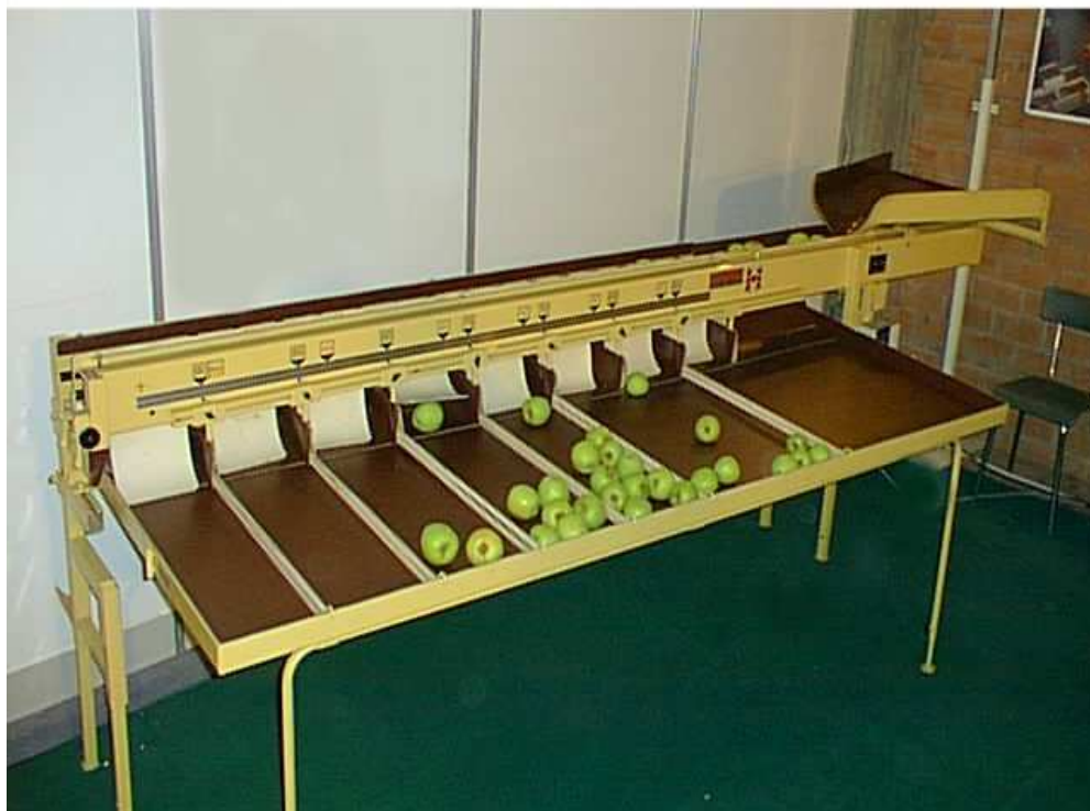
Calibreuse mécanique 1 ligne