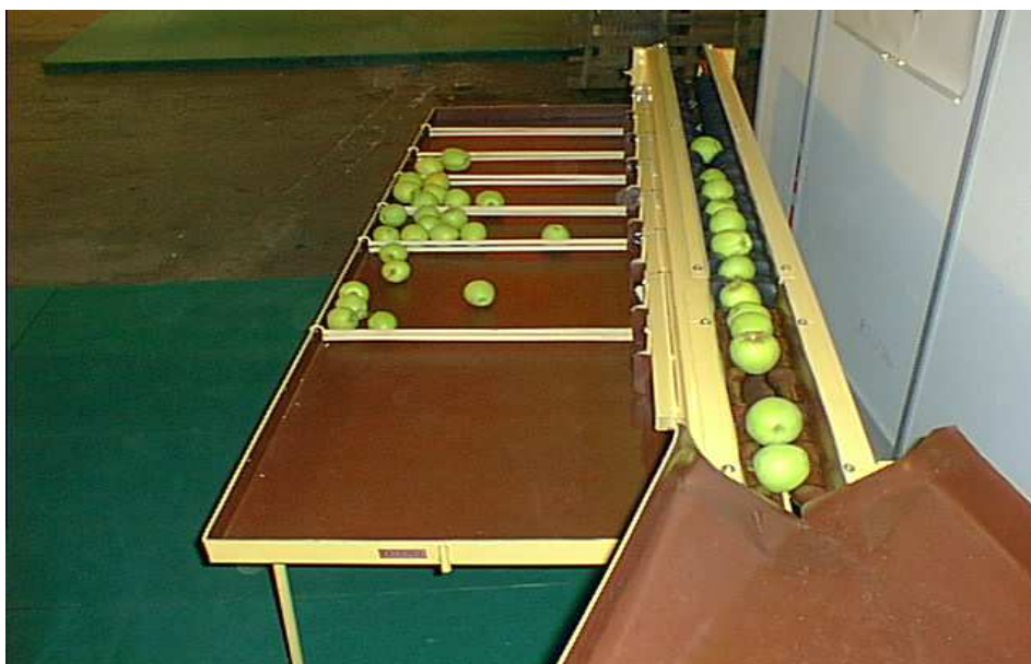
Calibreuse mécanique 1 ligne

Les calibreuses sont fabriquées en fonction du fruit à calibrer. (les vis de calibrages sont usinées en fonction du calibre minimum et du calibre maximum demandé)