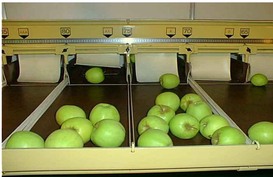
Calibreuse mécanique 1 ligne